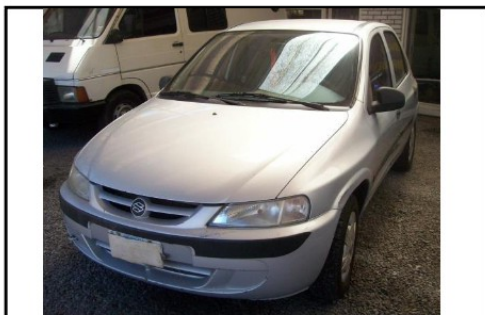
Vista ¾ delantera