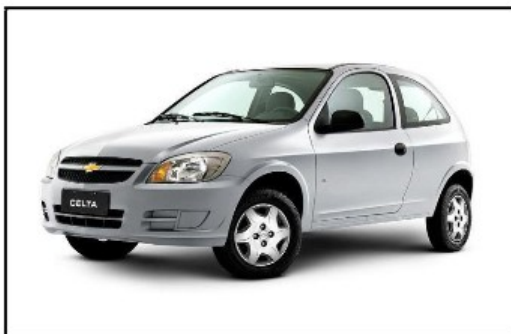
Vista ¾ delantera