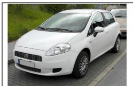
Vista ¼ delantera