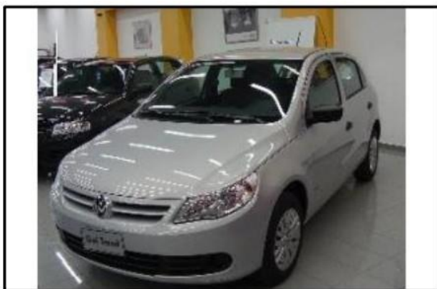
Vista ¾ delantera